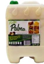
ACEITE DE OLEINA DE PALMA PALMOLEINA ®