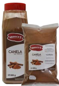
CANELA EN POLVO MERRICK'S®