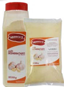
AJO EN POLVO MERRICK'S®