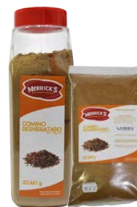
COMINO EN POLVO MERRICK'S®