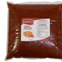
SALSA PARA PIZZA MERRICK'S®