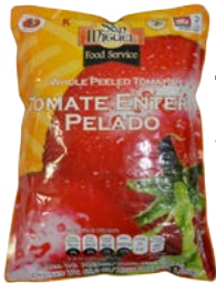
TOMATES ENTERO PELADO SAN MIGUEL®