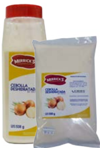
CEBOLLA EN POLVO MERRICK'S®