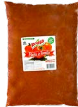
PASTA DE TOMATE 19 - 21° BRIX PRINSA®