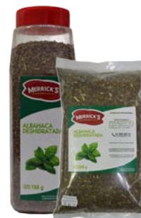
ALBAHACA DESHIDRATADA MERRICK'S®