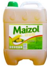
ACEITE DE MAÍZ MAIZOL ®