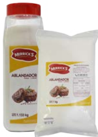
ABLANDADOR DE CARNE MERRICK'S®