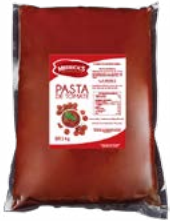
PASTA DE TOMATE MERRICK'S®